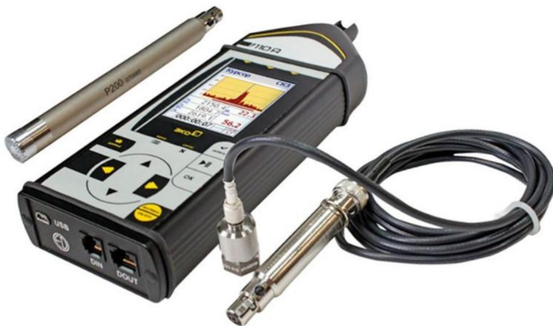
Рисунок 1 - «Шумомер - вибромер экофизика-110а»

Шумомер экофизика-110А (рис. 1)— портативный прибор, который объединяет функции шумомера, многоканального виброметра и анализатора спектра.