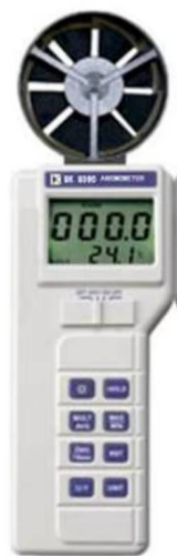
Рисунок 3 - «Термоанемометр ВК8360»

При измерении скорости движения воздуха в диапазоне от 0 до 5 м/с температура внутри измерительного щупа может возрастать на 2°С относительно температуры окружающей среды. Измерять температуру с нормированной погрешностью после измерения скорости воздушного потока можно через 30 мин.