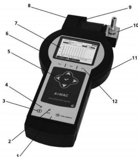
Рисунок 2 - «АТМАС анализатор пыли»

Наличие одноплатного компьютерного модуля позволяет задавать различные режимы измерений, проводить обработку результатов, контролировать рабочие параметры блоков анализатора пыли Атмас, представлять результаты измерений и хранить их в удобном виде, сбрасывать данные на флэш-память или на персональный компьютер через USB-порт. Сенсорный цветной жидкокристаллический дисплей высокого разрешения обеспечивает вывод результатов измерений на экран в удобной форме в виде таблиц и графиков. (рис. 2)