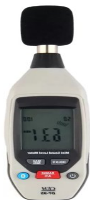
Рисунок 1 - «Шумомер цифровой DT-95»

Простые обычно используются для однократного измерения общего уровня шума в окружающей среде. Звуковую громкость они обычно измеряют в децибелах. Простые измерители часто используются для измерения показателя на рабочих местах, в транспортных средствах или других объектах, где необходимо контролировать уровень шума.