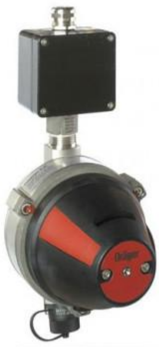
Рисунок 3 - «Газоанализатор инфракрасный Polytron IR (2IR) Drager»

Drager Polytron IR (2IR) (рис. 3) — взрывозащищённый инфракрасный газоанализатор, предназначенный для контроля уровня концентрации летучих токсичных, взрывоопасных компонентов.