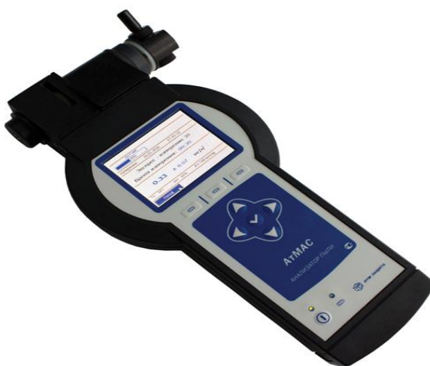
Рисунок 1 - «Пылемер Атмас»

Устройство и принцип работы анализатора пыли Атмас: