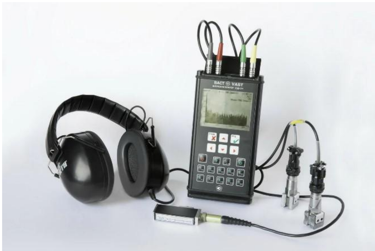
Рисунок 2 - «Виброметр СМ-21»

При работе разных по типу приборов используются различные методы определения характеристик колебаний. От этого зависит точность устройства.