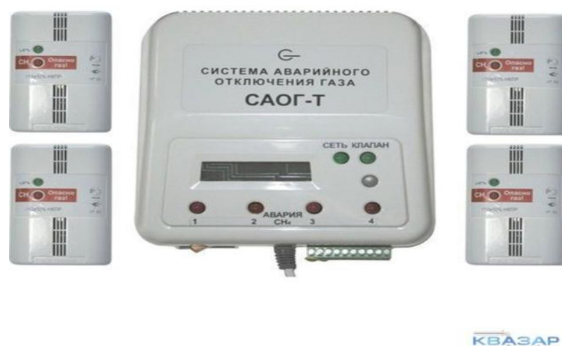
Рисунок 1 - «Система аварийного отключения газа САГО-Т»

Промышленные сигнализаторы газа представляют собой сложные устройства, в которые входят несколько датчиков, обеспечивающих контроль различных параметров в воздухе, а также пульт управления, на которые и приходят сигналы об изменении концентрации.