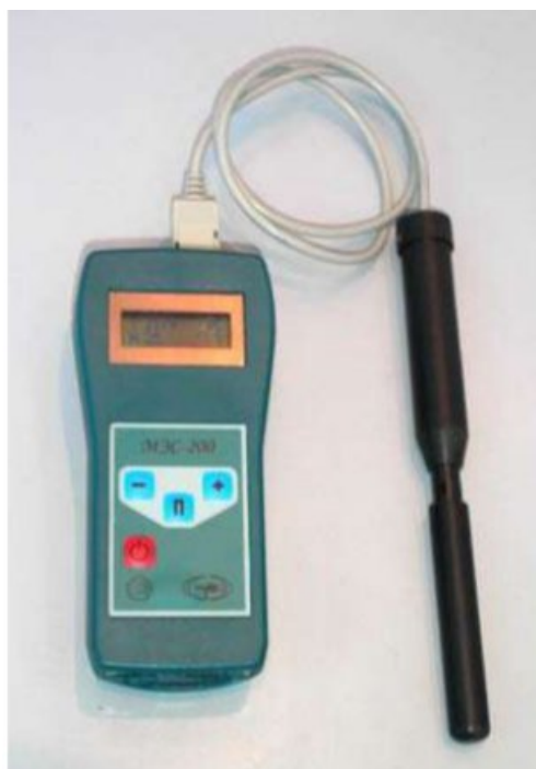
Рисунок 2 – «Метеометр МЭС - 200»

Порядок работы. При нажатии кнопки включается подсветка матричного индикатора на время 18–20 с. На индикаторе появляются надписи со значениями температуры и влажности. Если аккумуляторная батарея разряжена, надпись в верхней строке будет мигать с частотой 1–2 Гц. В этом случае необходимо выключить МЭС и произвести зарядку аккумуляторов.