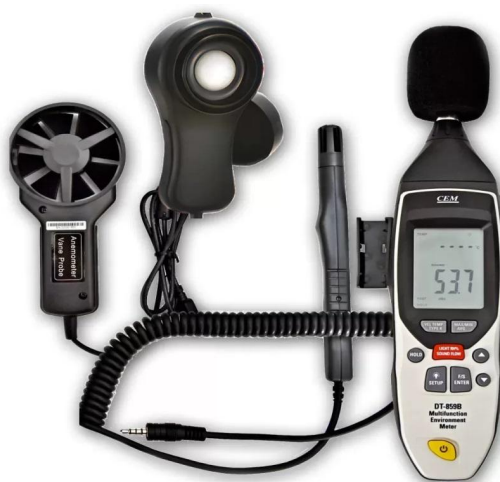
Рис.2 «Многофункциональный измеритель окружающей среды CEM DT-859B»

Портативный многофункциональный измеритель окружающей среды. Прибор объединяет функции шумомера, люксметра, гигрометра, термометра и термоанемометра.(рис. 2)