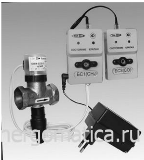
Рисунок 2 - «МАГ-1 комплект контроля загазованности ККЗ»

МАГ-1 (комплект контроля загазованности ККЗ) (рис. 2) предназначен для непрерывного автоматического контроля превышения установленных порогов тревожной и аварийной концентрации природного газа ( \text{CH}_4 ) и угарного газа ( \text{CO} ) в производственных и бытовых помещениях.