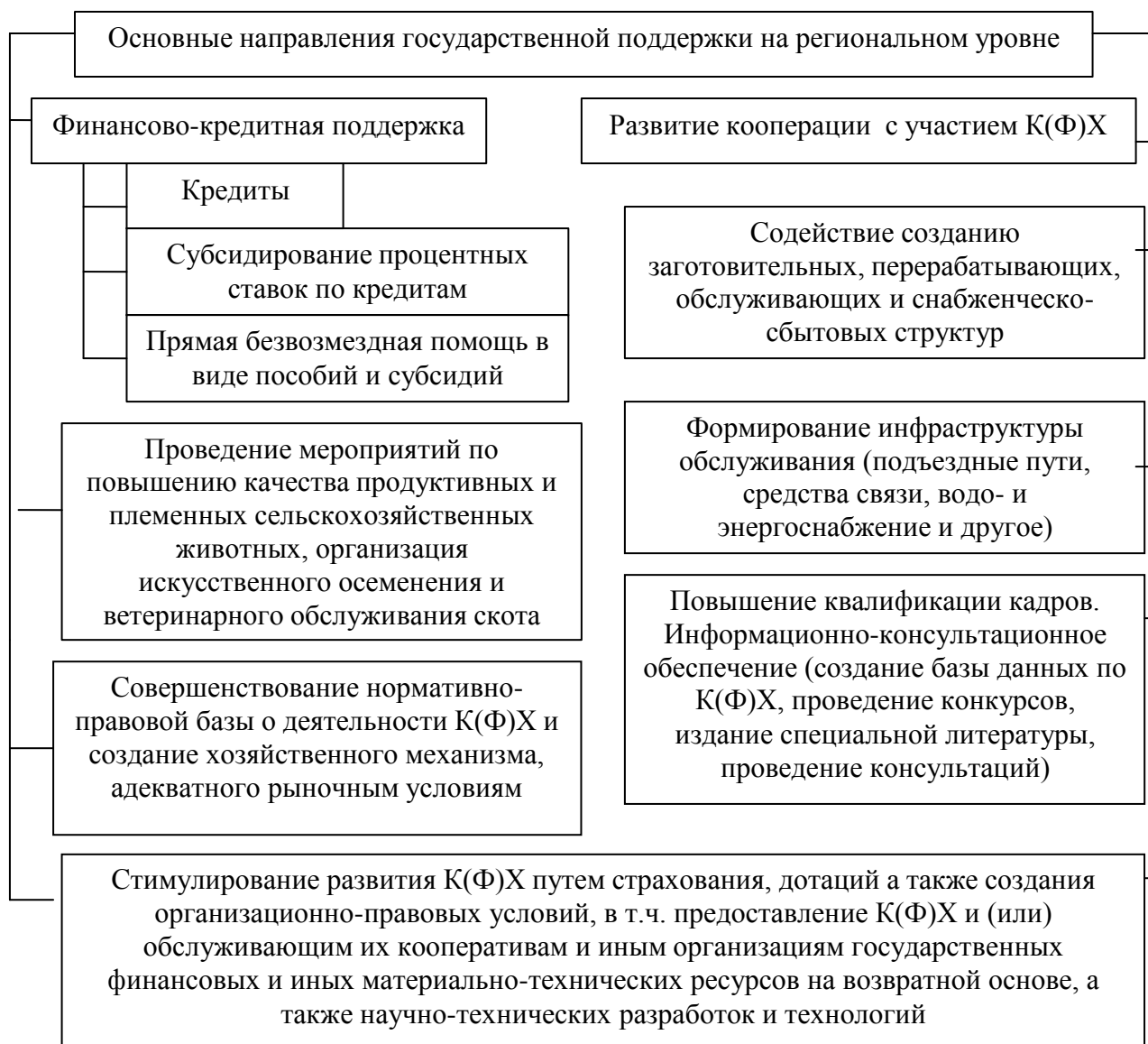
Рисунок 3 – Направления государственной поддержки крестьянских (фермерских) хозяйств Забайкальского края

Одним из средств поддержки К(Ф)Х может стать выделение субсидии на производство продукции растениеводства на низкопродуктивных пашнях. Необходимость пара в Забайкалье обусловлена природно – климатическими условиями. Малое количество осадков, неравномерность их распределения по сезонам года, значительная потенциальная засоренность пашни делает пар