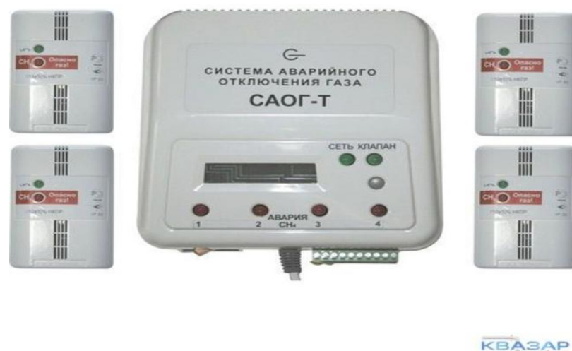
Рисунок 1 - «Система аварийного отключения газа САГО-Т»

Промышленные сигнализаторы газа представляют собой сложные устройства, в которые входят несколько датчиков, обеспечивающих контроль различных параметров в воздухе, а также пульт управления, на которые и приходят сигналы об изменении концентрации.