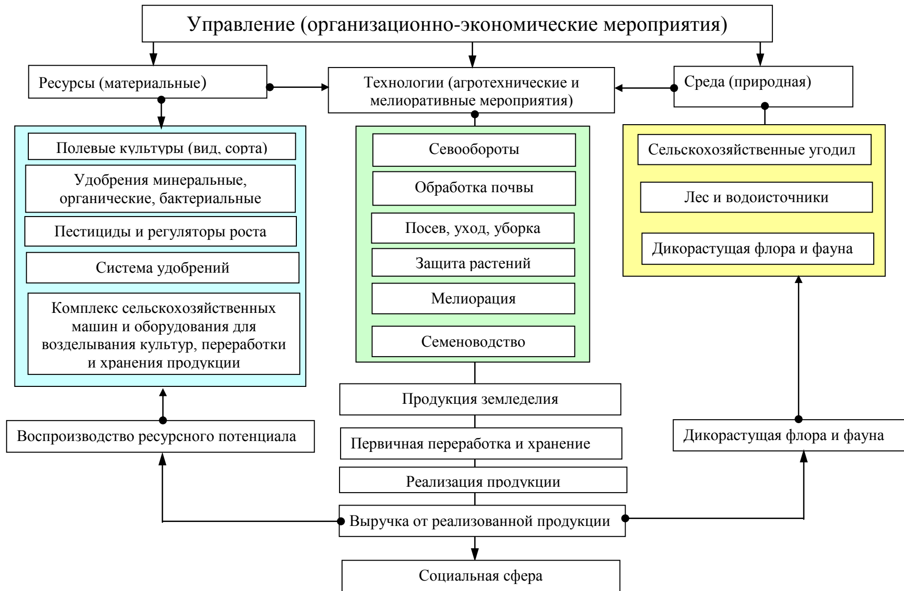
Рис.2. Структура имитационной модели функционирования систем земледелия