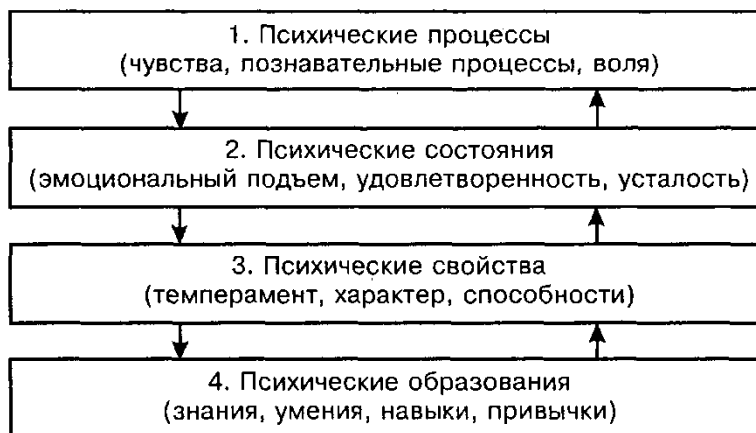
Рис. 1. Психические явления человека

(детерминантой) поведения. На человека влияет социальная среда (процессы, происходящие в ней на макро- и микроуровне), поэтому его сознание имеет свою системную и смысловую организацию . Различные проявления психики образуют бессознательную сферу . Эта сфера также является предметом психологии, помогающим выявить характер соответствия действительных мотивов, установок и ориентации личности (рис. 1).