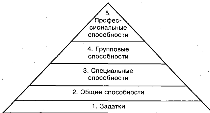
Рис.1. "Конус способностей"

На рис. 1 наглядно представлена динамика и трансформация способностей.