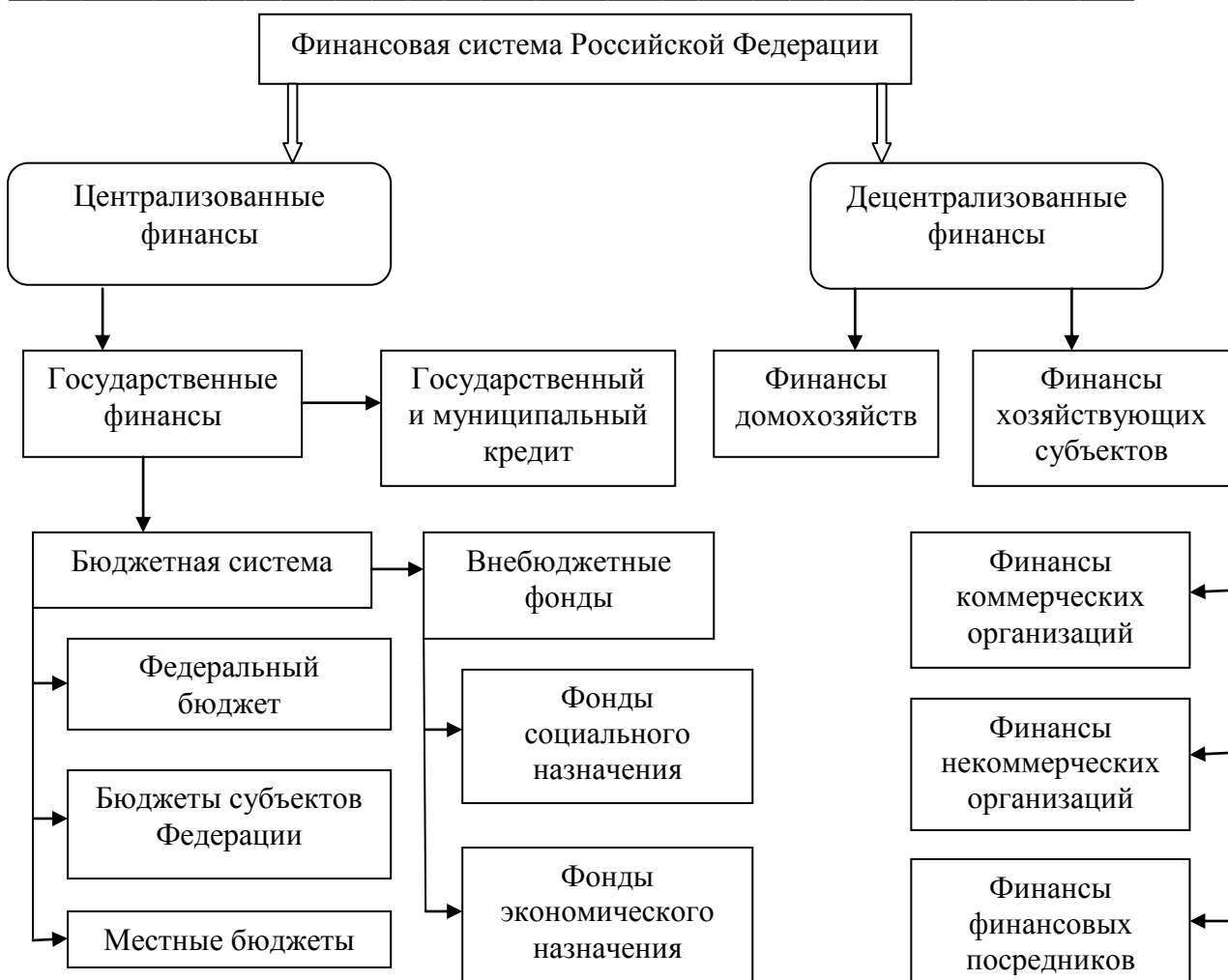
Рисунок 1 –Схема финансовой системы Российской Федерации