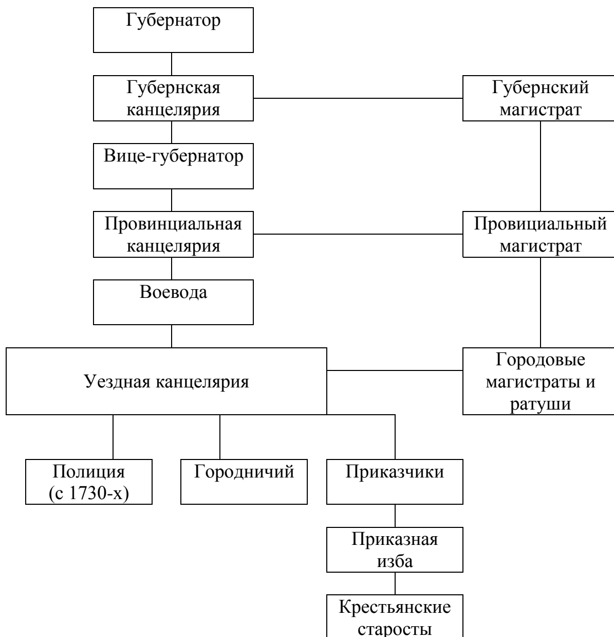
Схема управления Сибирью в 1720 – 1760-х годах.