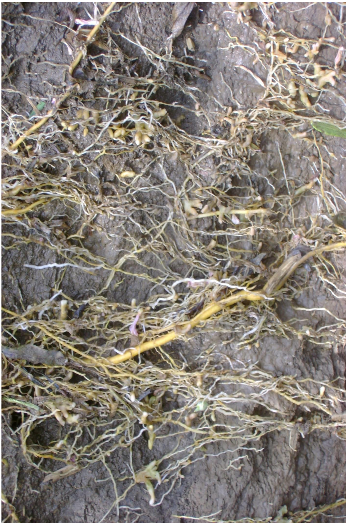
Рисунок 2 – Корневая система эспарцета песчаного