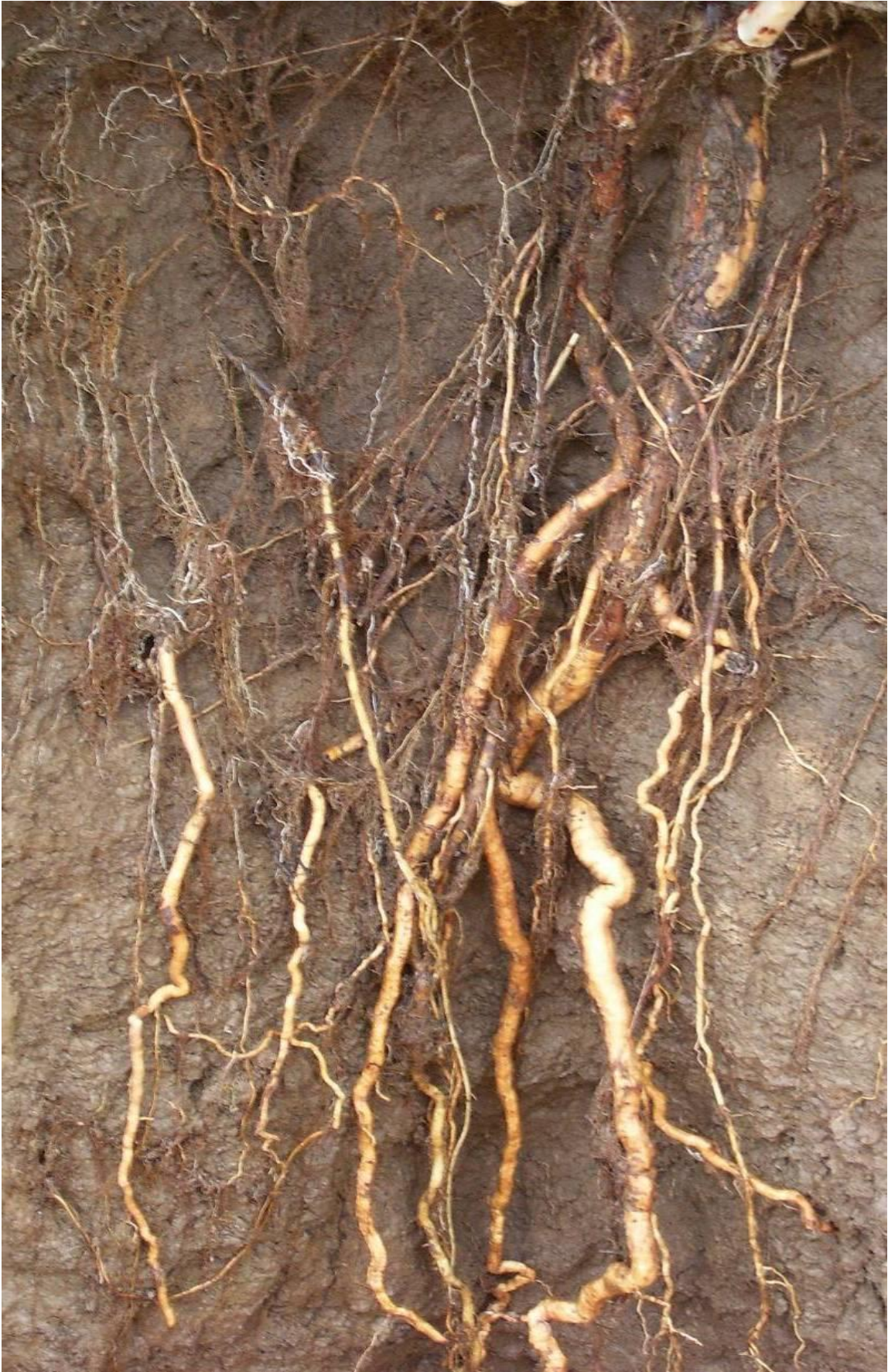
Рисунок 3 – Корневая система горца растопыренного