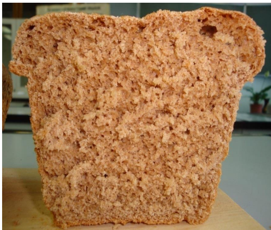
Рисунок 5 – Пробная выпечка хлеба из муки пшеницы, выращенной после козлятника восточного

Во второй год действия предшественника наблюдалось снижение качества зерна во всех исследуемых вариантах. Наибольшее снижение качественных показателей зерна отмечалось в посевах пшеницы, размещённой по чистому пару. Козлятник восточный, эспарцет песчаный, люцерна посевная, горец растопыренный, свербига восточная как предшественники обеспечивали получение зерна высокого качества.