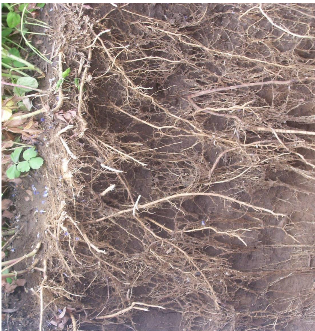
Рисунок 1 – Корневая система козлятника восточного

Хорошо развитые стержневые корни фитомелиоративных растений пронизывают плотные подпахотные горизонты, улучшая пористость почвы. Отмирая, корни оставляют многочисленные поры, наполненные воздухом, водой и рыхлым органическим веществом. Корни дренируют почву на большую глубину и это способствует улучшению сложения почвы и росту урожайности последующих культур. В этом главное отличие фитомелиорации от сидерации.