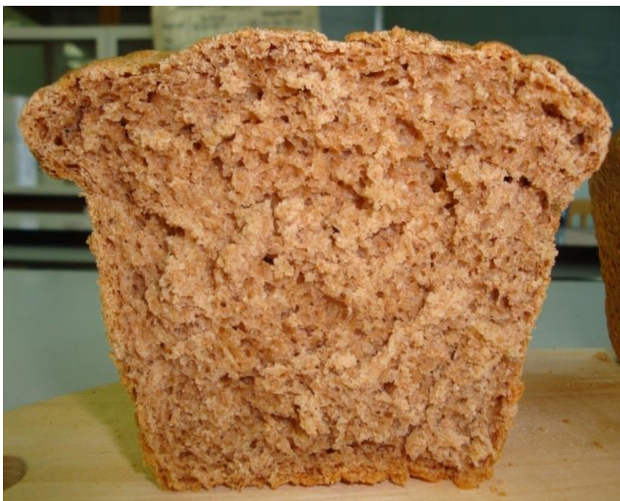
Рисунок 6 – Пробная выпечка хлеба из муки пшеницы, выращенной после костреца безостого

Содержание белка в зерне пшеницы, полученного в экспериментальных звеньях севооборотов, колебалось от 14,0 (при размещении её по пару) до 14,8% (при размещении её по козлятнику восточному), что соответствовало требованиям стандарта. Содержание сырой клейковины было на уровне требований стандарта лишь в зерне, полученном при размещении пшеницы по новым и малораспространённым растениям.