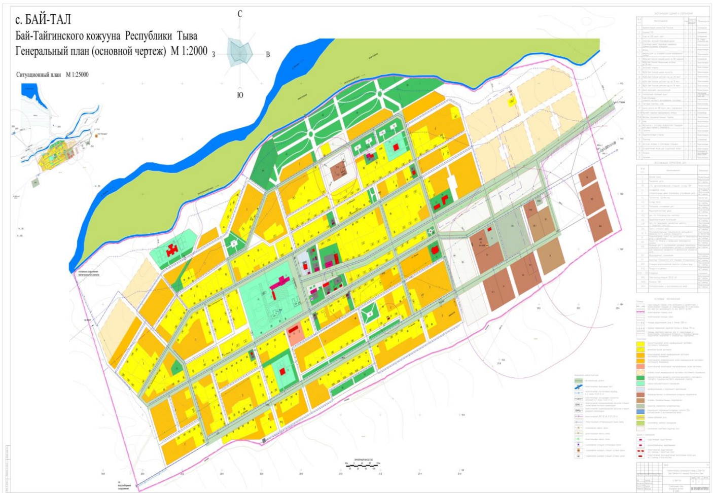
Рисунок 4.1 Схема генерального плана Бай-Тайгинского кожууна Республики Тыва