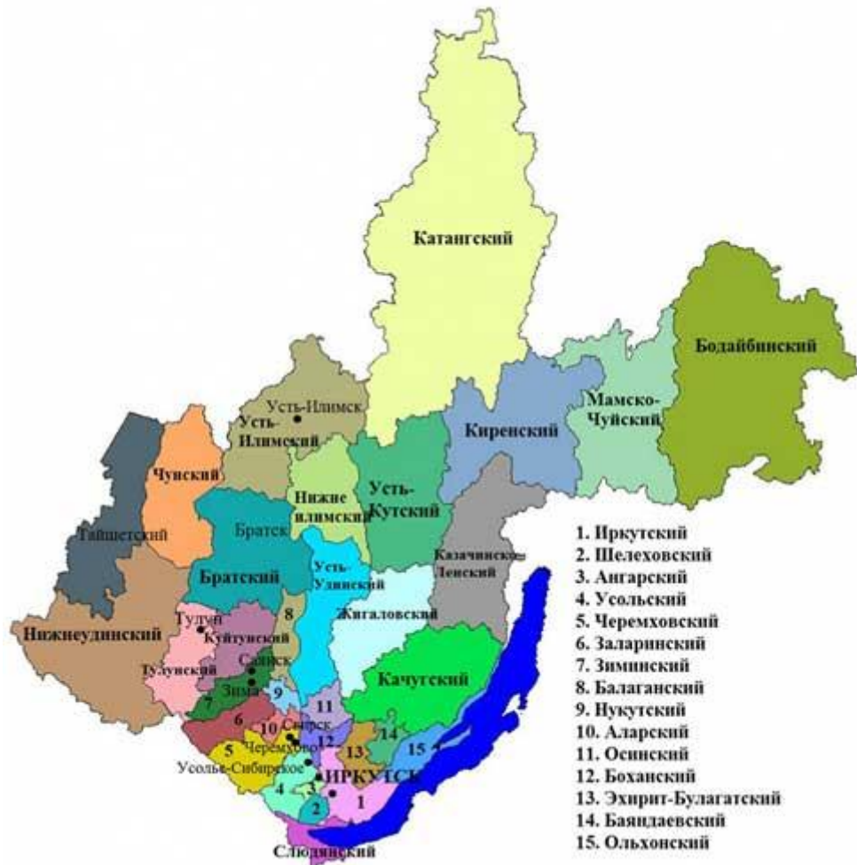
Рисунок .2.2 – Обзорная карта Иркутской области