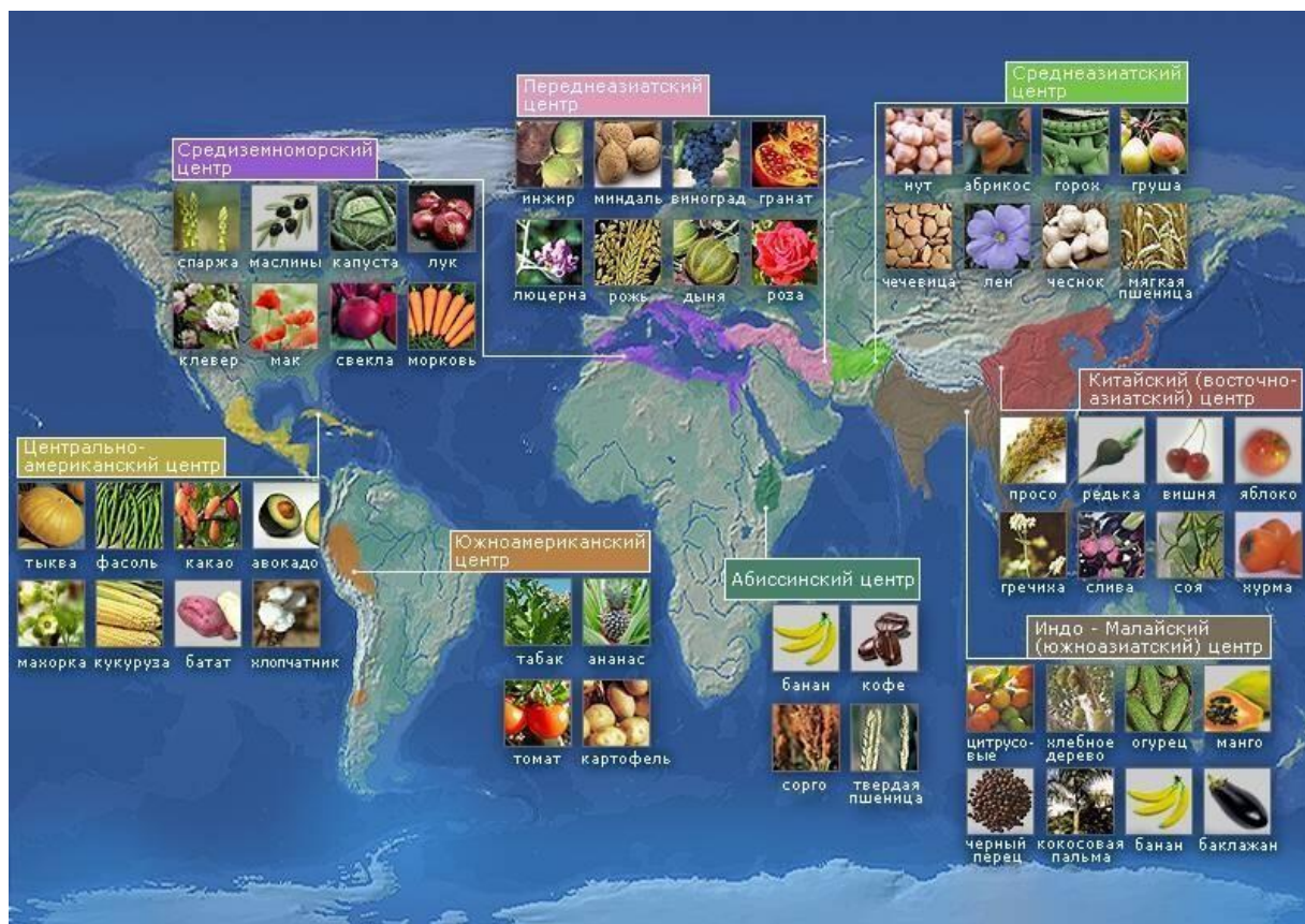
Рис. 2 – Основные семь географических центров происхождения культурных растений

Китайско-Японский. Мировое растениеводство обязано Восточной Азии происхождением многих культурных видов. Среди них – рис, многорядные и голозерные ячмени, просо, чумиза, голозерные овсы, фасоль, соя, редька, многие виды яблонь, груш и лука, абрикосы, очень ценные виды сливы, восточная хурма, возможно, апельсин, тутовое дерево, сахарный тростник китайский, чайное дерево, коротковолокнистый хлопчатник.