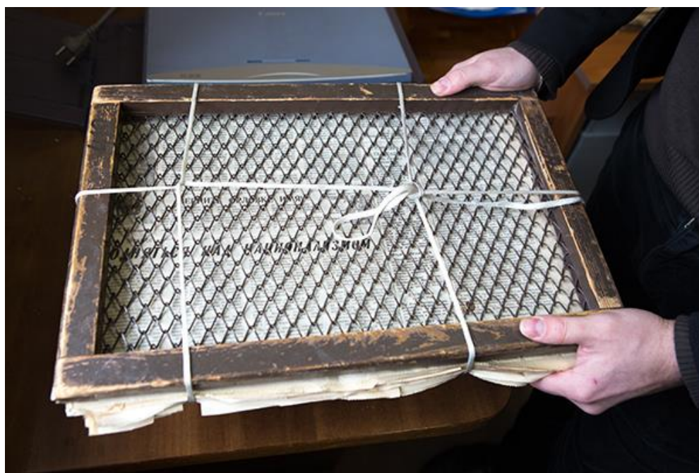
Рисунок 1 – Пресс для сушки гербария

Пресс должен быть стянут равномерно по всей поверхности, поэтому нужно обвязать его таким образом, чтобы в итоге получилось две поперечные стяжки и одна-две продольные. Также можно сделать двойную обвязку крест-накрест, а потом дополнительными узлами растянуть верёвку по направлению к углам прессы. Фотография перевязанного прессы показана ниже.