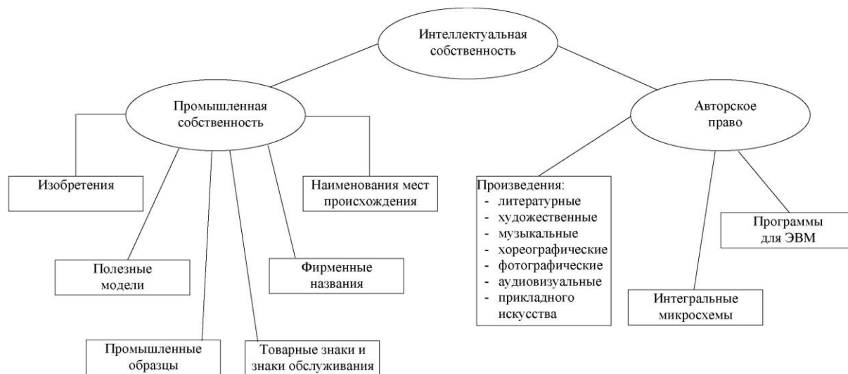
Рис.4. Сферы прав интеллектуальной собственности

Во всех случаях защита охраноспособного объекта интеллектуальной собственности должна быть оформлена надлежащим образом. (Алексеев и др., 2012)