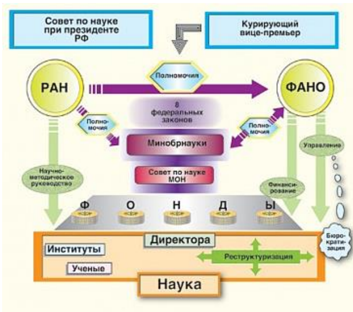
Рис. 2. Академик В.Е. Фортов: Нынешняя схема управления наукой больше похожа на спутанный клубок.

Государственные фонды поддержки научной, научно-технической и инновационной деятельности представляют собой квазигосударственные организации, финансируемые за счет средств государственного бюджета. Подобные фонды практически во всех развитых странах представляют собой основной инструмент реализации государственной научно-технической политики, что, несомненно, обуславливает некоторую политическую подчиненность таких фондов, степень которой варьируется в зависимости от типа фонда и страны. Однако западные фонды обладают достаточной свободой в области принятия решений о направлениях распределения денежных средств, в первую очередь грантов. Вообще следует отметить, что в зарубежной практике редко употребляются иные, кроме грантов (grants), виды финансирования научных исследований. Даже собственно базовое финансирование основывается на предоставлении грантов специальными фондами (grant agencies), являющимися государственными или получающими государственное финансирование. (Черных и др., 2013)