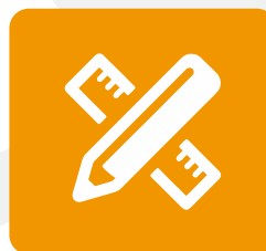
ФАКУЛЬТЕТ УПРАВЛЕНИЯ ЗЕМЕЛЬНЫМИ РЕСУРСАМИ, АРХИТЕКТУРЫ И ДИЗАЙНА