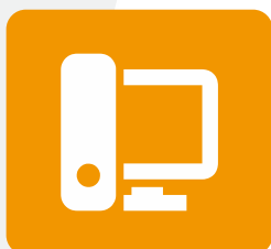
ФАКУЛЬТЕТ КОМПЬЮТЕРНЫХ СИСТЕМ И ПРОФЕССИОНАЛЬНОГО ОБРАЗОВАНИЯ