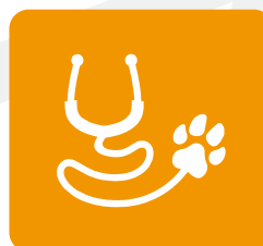
ФАКУЛЬТЕТ ВЕТЕРИНАРИИ И ТЕХНОЛОГИИ ЖИВОТНОВОДСТВА