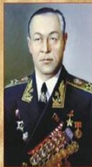
КУЗНЕЦОВ Николай Герасимович (1902 - 1974)