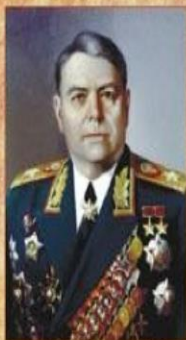
ВАСИЛЕВСКИЙ Александр Михайлович (1895 - 1977)