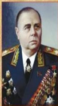
МЕРЕЦКОВ Кирилл Афанасьевич (1897 - 1968)