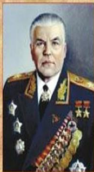
МАЛИНОВСКИЙ Резвон Яковлевич (1898 - 1967)