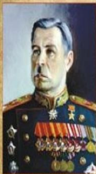
ГОВОРОВ Леонид Александрович (1897 - 1955)