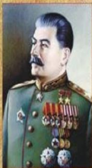
СТАЛИН Иосиф Виссарионович (1879 - 1953)