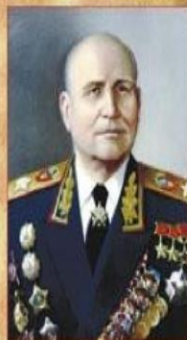
КОНЕВ Иван Степанович (1897 - 1973)