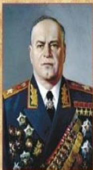
ЖУКОВ Георгий Константинович (1896 - 1974)