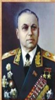
РОКОССОВСКИЙ Константин Константинович (1896 - 1968)