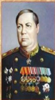
ТОЛБУХИН Феликс Иванович (1894 - 1949)